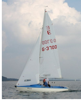
Abbildung 4.4: Conger Jolle