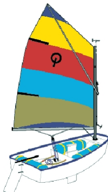
Abbildung 4.1: Optimist Jugendjolle