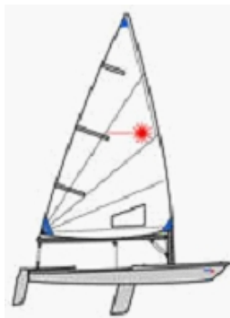
Abbildung 4.3: Laser Jolle

ursprüngliche Name «Freetime». Der Name Laser wurde von einem kanadischen Studenten vorgeschlagen, weil er modern klingt.